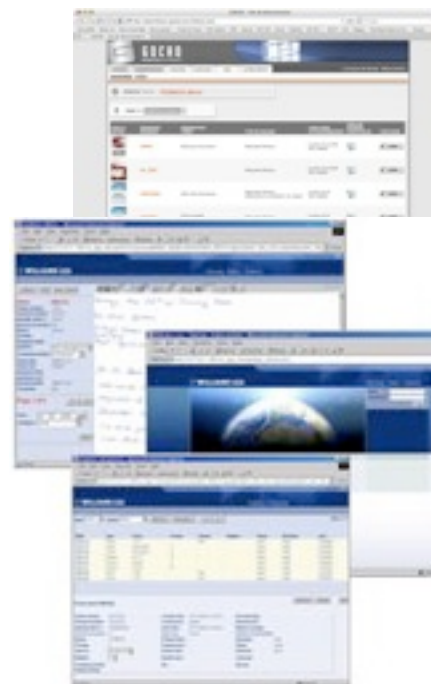
Exemple d'interfaces utilisateur