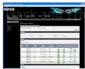
Rapports Web sur l'état de la production en temps réel.